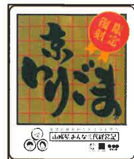
伝説の京いりごま パッケージデザイン